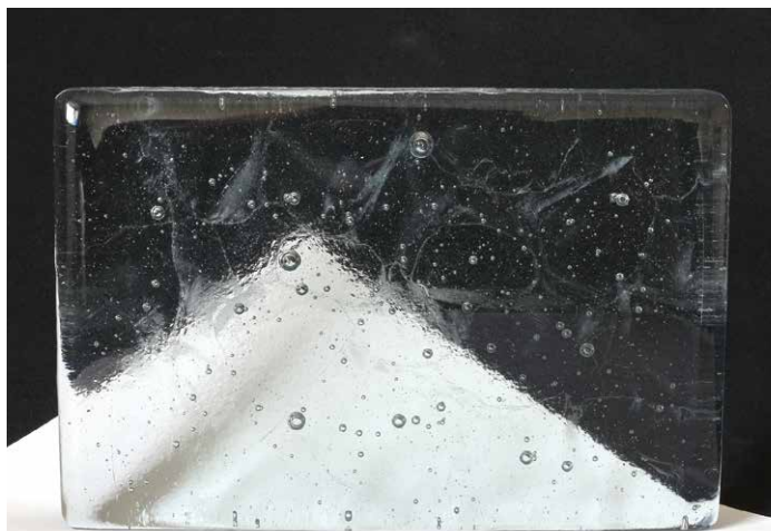
■ 名 称 : Drop-CRT-c ■ 使用ガラス: 廃ブラウン管(パネル)リサイクルガラス100% ■ 色・透明度: ■ 淡い灰色透明