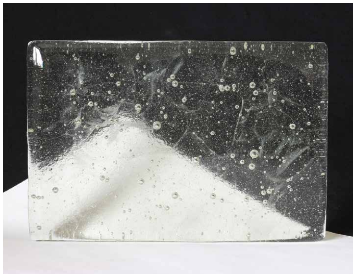
■ 名 称 : Drop-FL ■ 使用ガラス: 廃蛍光灯リサイクルガラス100% ■ 色・透明度: ■ 淡い黄緑色透明