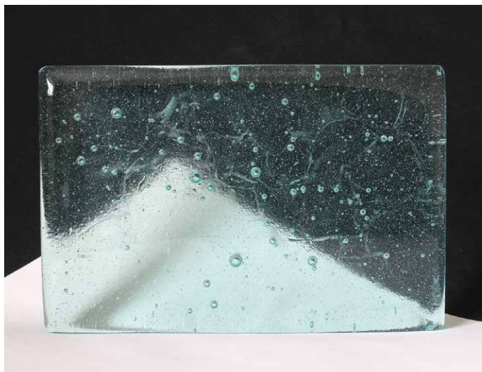
■ 名 称 : Drop-NX ■ 使用ガラス: 廃ナトリウム灯リサイクルガラス100% ■ 色・透明度: ■ 淡い水色透明